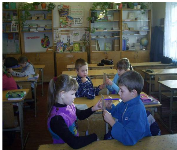
Схема работы в парах сменного состава («ручеек»)

3-я группа (с высоким уровнем обучаемости) выполняет задание самостоятельно, в парах сменного состава или по принципу «ручейка». На столах учащихся лежат пронумерованные карточки, каждый ученик работает с одной карточкой. Решил – проверил. Решивший встает и ждет последнего учащегося. По сигналу руководителя (учитель произносит слово «переход») группы переходят за столы, где им предстоит решить более сложные задания. Меняются до тех пор, пока каждый ученик не окажется на исходной позиции.